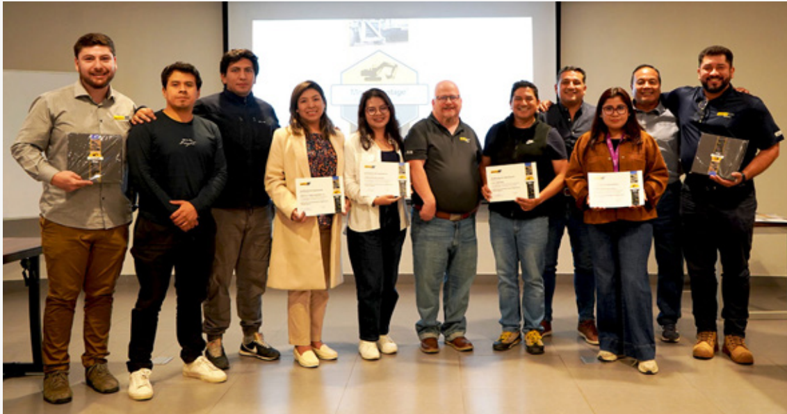
MineAdvantage™ (MA) courses, available in multiple languages.

Permasalahan yang dihadapi sektor pertambangan dalam pengembangan Pengawas Operasional: