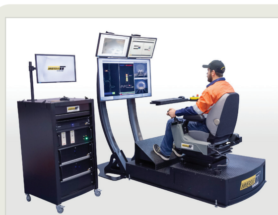
Simulador para Cat® Command para Subterrâneo